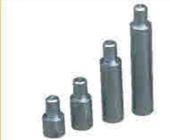
4 pcs piston lengthening arms 4 adet piston uzatma kolları