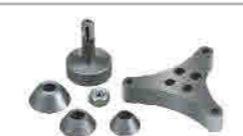
Motorcycle flange kit Motoküret fişang kiti