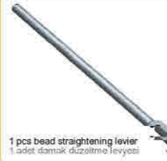
1 pcs bead straightening lever 1 adet damak düzeltme levyesi