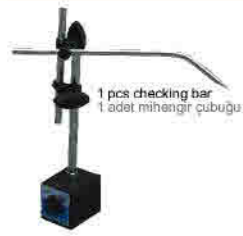
1 pcs checking bar 1 adet mihengir çubuğu