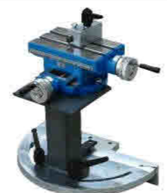
Turn table lathe support Döner tabanlı torna suportsu