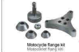
Motorcycle flange kit Motosiklet flanş kiti