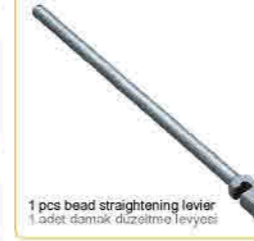
1 pcs bead straightening lever 1 adet damak düzeltme levyesi