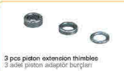
3 pcs piston extension thimbles 3 adet piston adaptör burçları