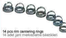
14 pcs rim centering rings 14 adet jant merkezleme bilezikleri