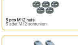
5 pcs M12 nuts 5 adet M12 somunları