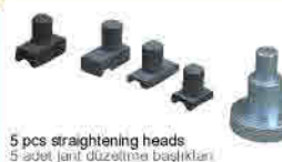
5 pcs straightening heads 5 adet jant düzeltme başlıkları