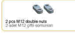
2 pcs M12 double nuts 2 adet M12 çiftli somunları