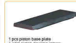
1 pcs piston base plate 1 adet piston dayama laması