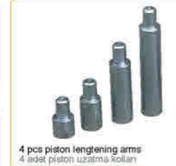
4 pcs piston lengthening arms 4 adet piston uzatma kolları