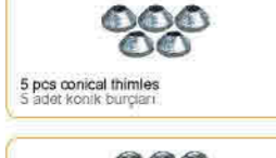
5 pcs conical thimbles 5 adet konik burçları