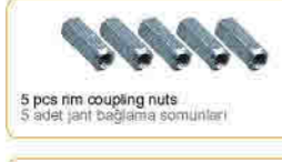
5 pcs rim coupling nuts 5 adet jant bağlama somunları