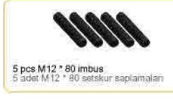
5 pcs M12 * 80 imbus 5 adet M12 * 80 setskur saplamaları