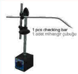
1 pcs magnetic gauge 1 adet mıknatıslı komparator ayağı