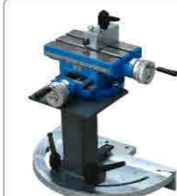
Turn table lathe support Döner tabanlı torna suportsu