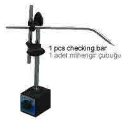
1 pcs checking bar 1 adet mihengir çubuğu