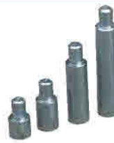
4 pcs piston lengthening arms 4 adet piston uzatma kolları