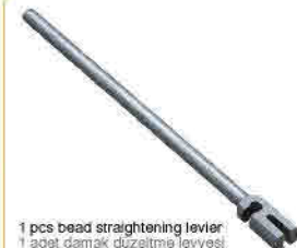
1 pcs bead straightening lever 1 adet damak düzeltme leviyesi